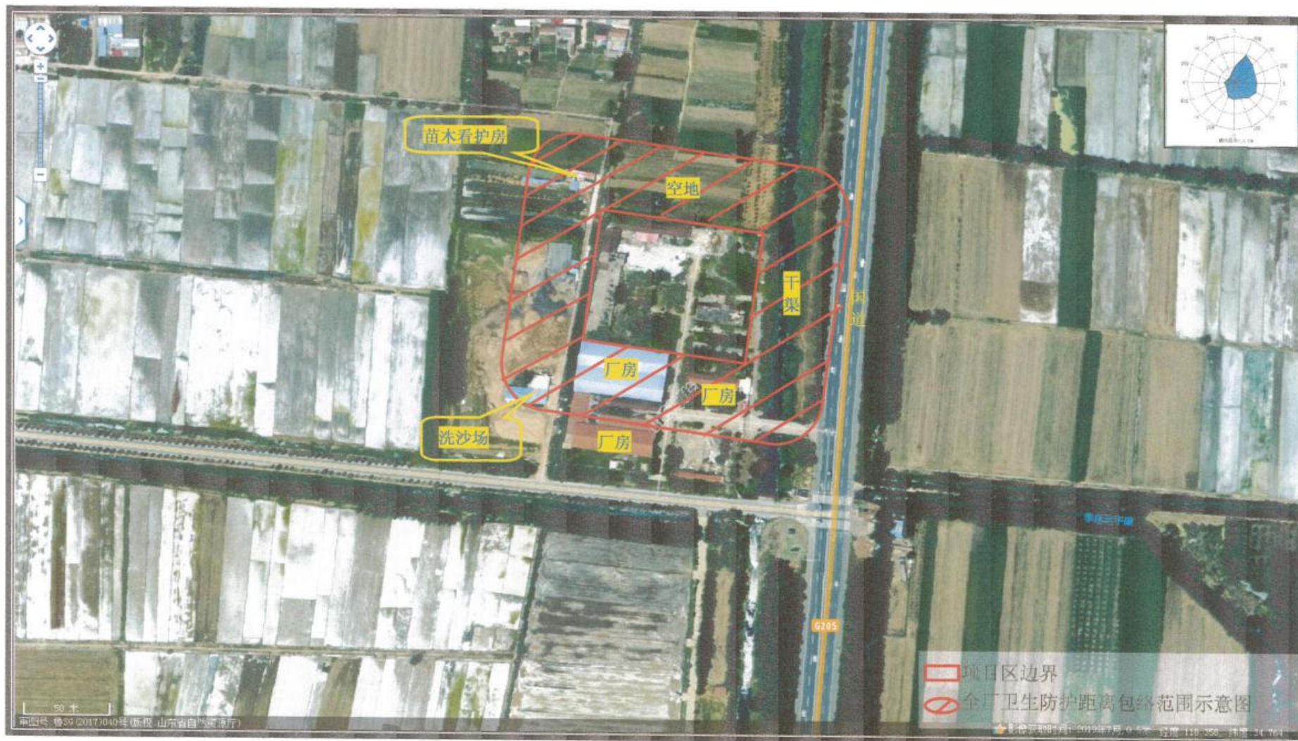
附图 3 卫生防护距离包络图