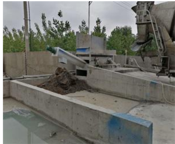
图 4-6 砂石分离机