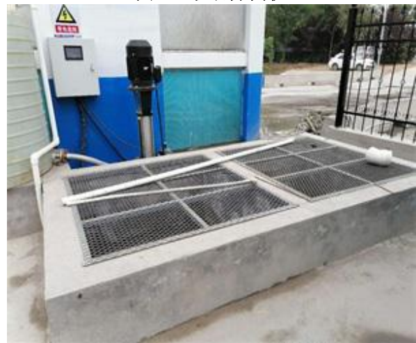
图 4-8 洗车机配套二级沉淀池