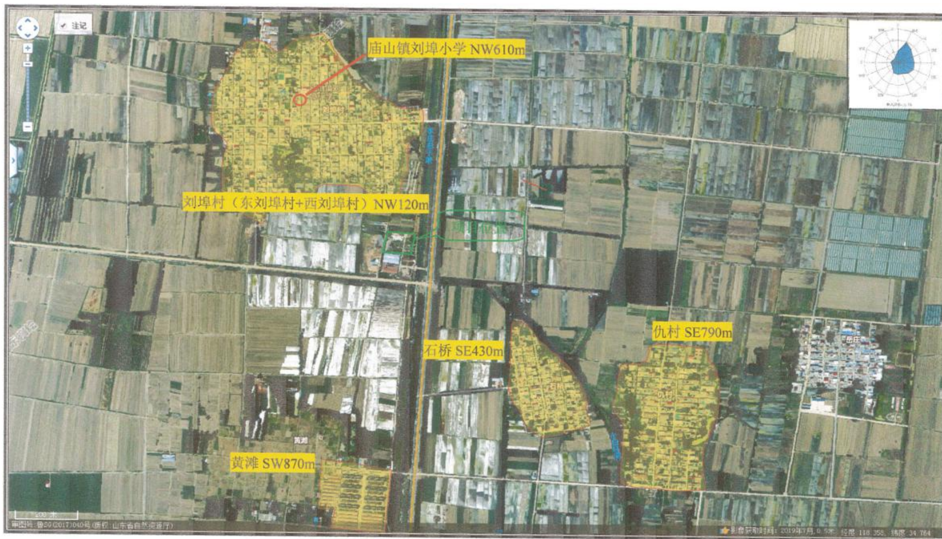
附图 2 项目周围敏感目标图