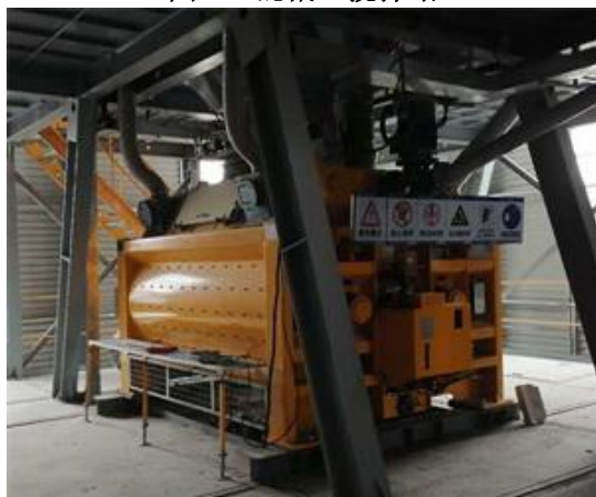
图 3-5 搅拌机