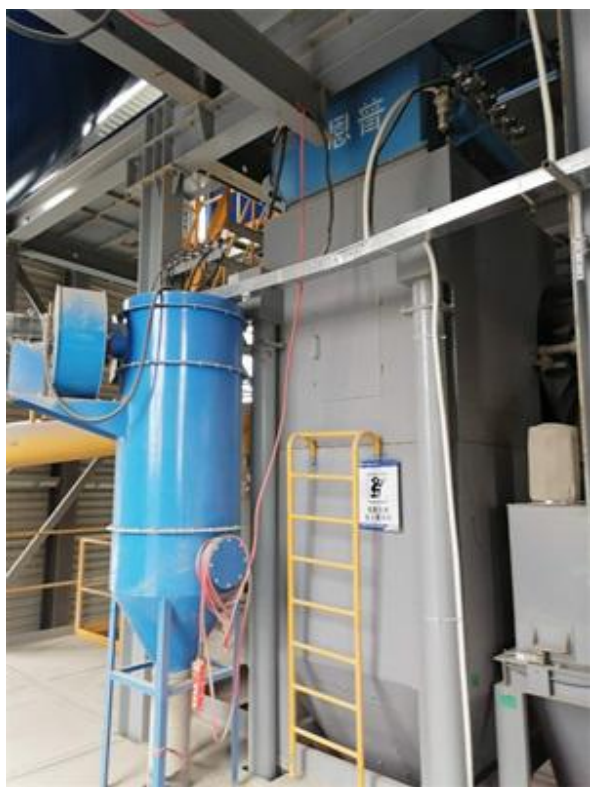
图 4-1 脉冲布袋除尘器