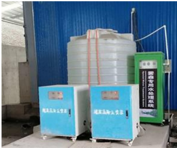
图 4-5 车间水喷淋系统