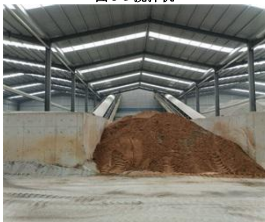
图 3-7 原料车间