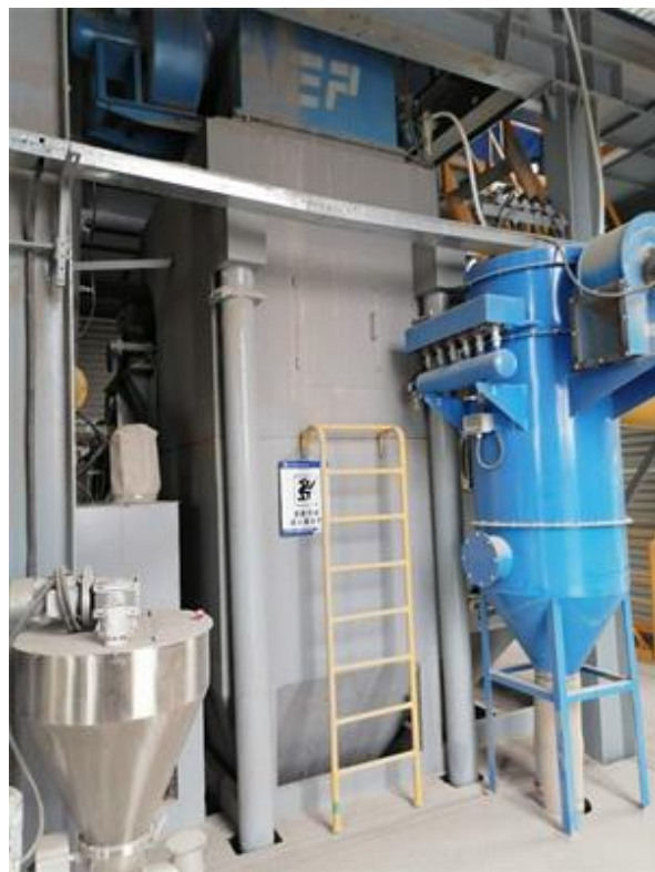
图 4-2 脉冲布袋除尘器