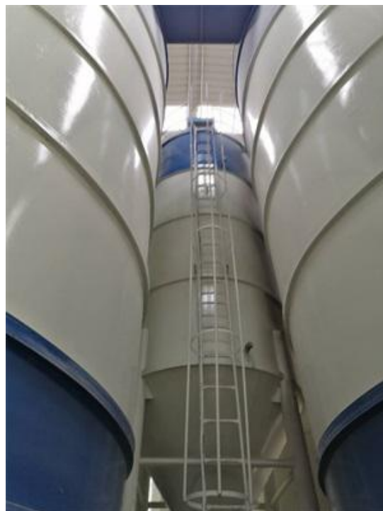
图 3-4 筒仓