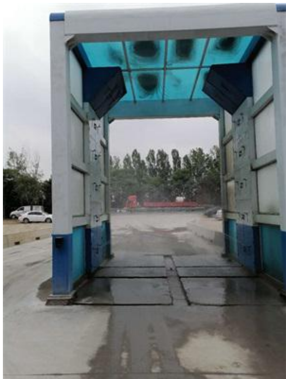
图 4-3 洗车机