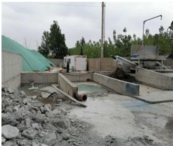
图 4-7 三级沉淀池