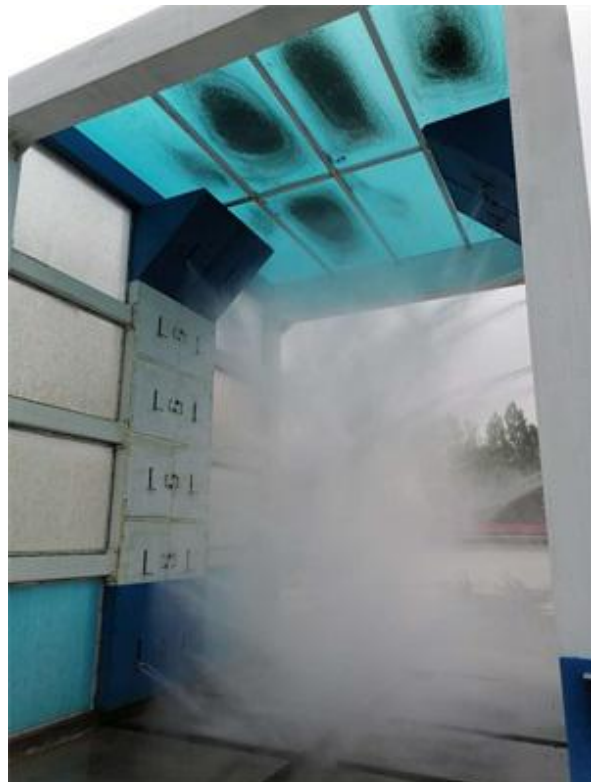
图 4-4 洗车机运行效果