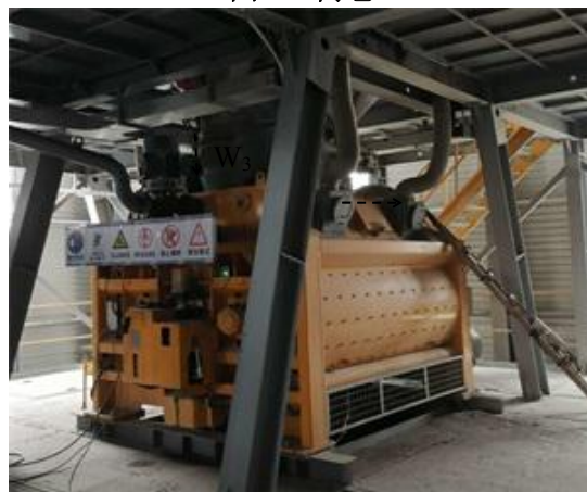
图 3-6 搅拌机