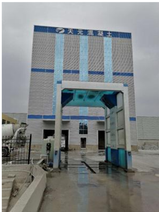
图 3-3 混凝土搅拌站