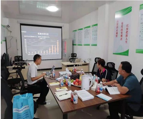
附图 1 验收会议现场