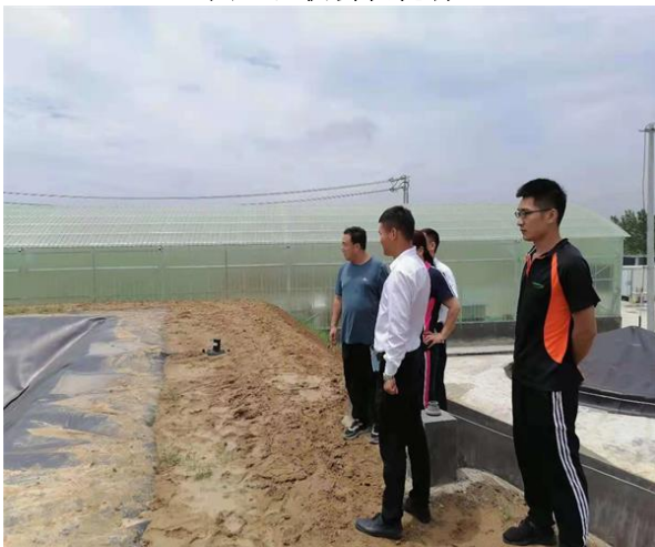
附图 5 验收会议现场