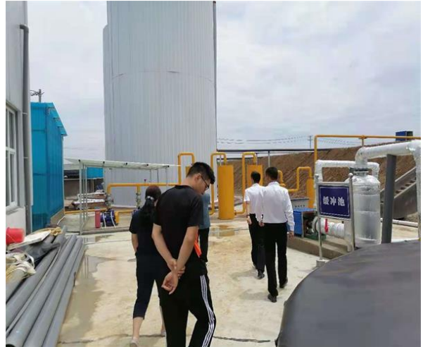
附图 2 验收会议现场