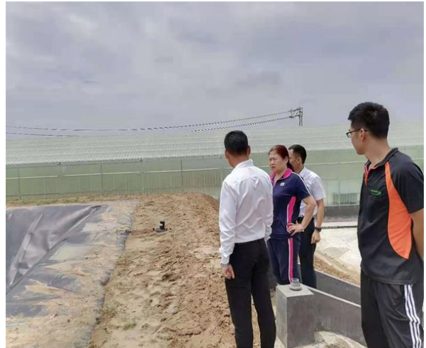
附图 4 验收会议现场