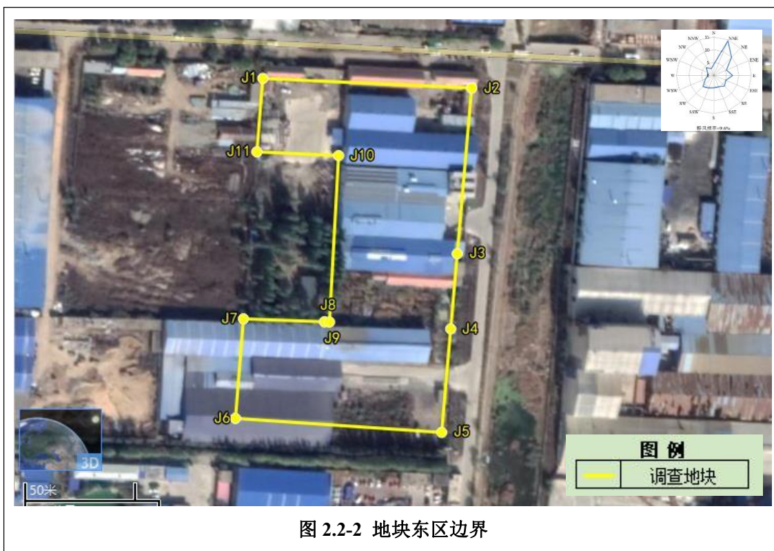
表 2.2.3 地块调查范围拐点坐标（2000 坐标系）