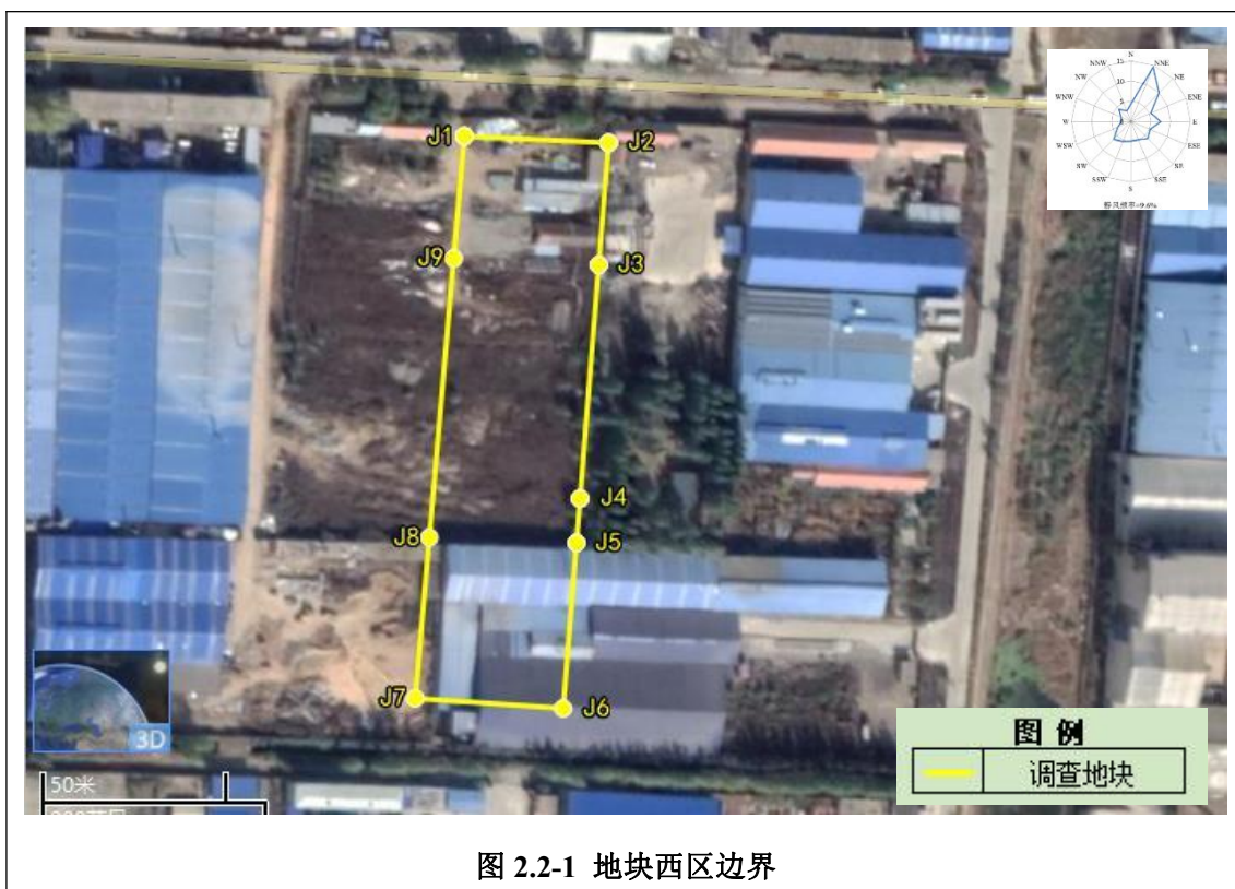
表 2.2-2 地块东区拐点坐标（2000 坐标系）